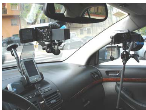
GRABACIÓN DATOS GPS/VIDEO